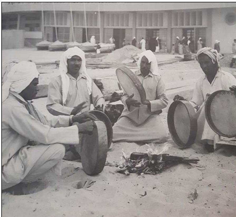
Obrázek 7. Spirituální zpěv a bubnování byly nedílnou součástí plavby

věnovaly. Nástrojům přisuzovali mystickou a mýtickou sílu, staly se objekty zbožštění. Byly spojením se spirituálním světem a zdrojem odporu vůči opresivní sociální struktuře. Někdy otroci předstírali posedlost duchy, aby unikli trestům a zastrašili pány. Někteří potápěči byli údajně posedlí démony (džiny), ale jednalo se pravděpodobně o následky přetlaku z potápění ve velkých hloubkách. Zkušení potápěči byli schopni socializovat se i pod vodou.