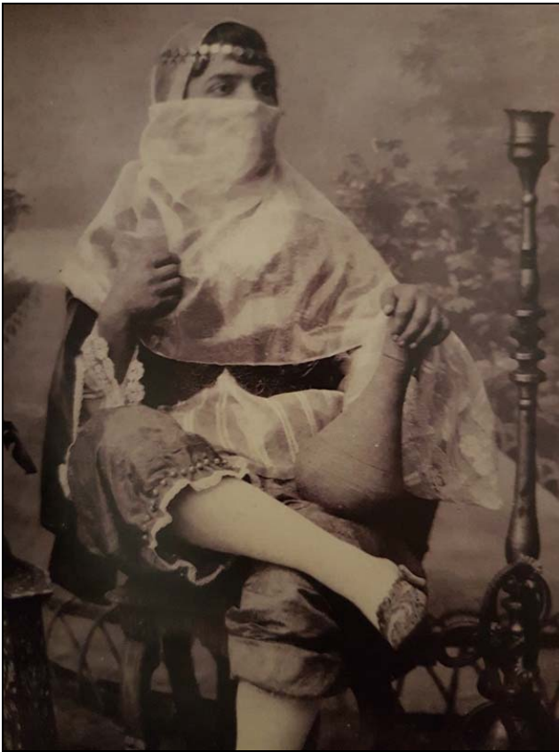
Obrázek 3. Suriya, otrokyně se statusem vedlejší manželky