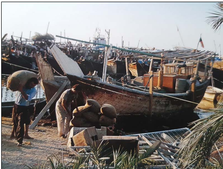
Obrázek 5. Vykládání nákladu z dhow v kuvajtském přístavu