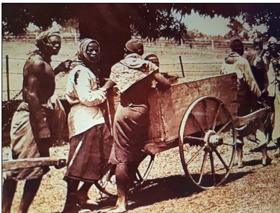
Obrázek 2. Konvoj otroků na Zanzibaru, 19. století

v Súdánu a britská okupace Egypta v roce 1882 měly za následek ukončení obchodu. 59 Propuštění otroci získali certifikát, který jim měl pomoci najít práci. Snaha vymýtit otroctví v ostatních zemích regionu vycházela z iniciativy britské vlády v Egyptě. 60