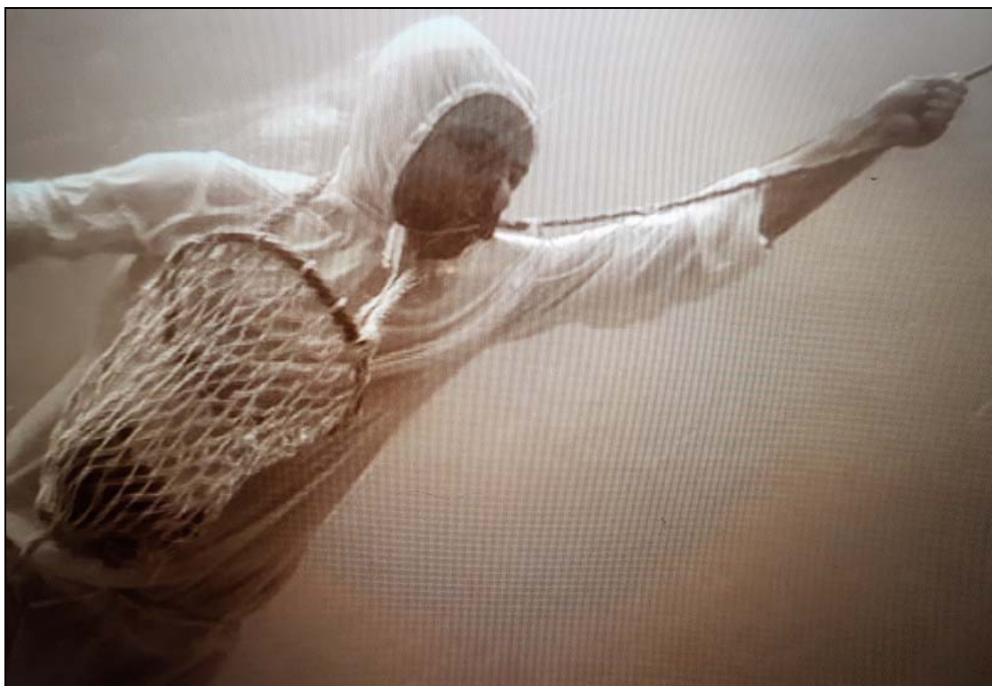
Obrázek 8. Potápěč lovící perly v Kataru

v Maskatu a dnešním Ománu. 124 Žádosti o certifikáty osvobozující z otroctví tvořily jen asi dvě procenta. To svědčí i o tom, že ani svobodní nežili v dobrých podmínkách.