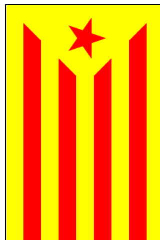
Obrázek 4. Estelada roja