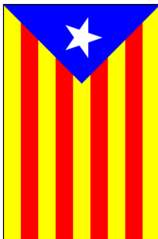
Obrázek 3. Estelada blau