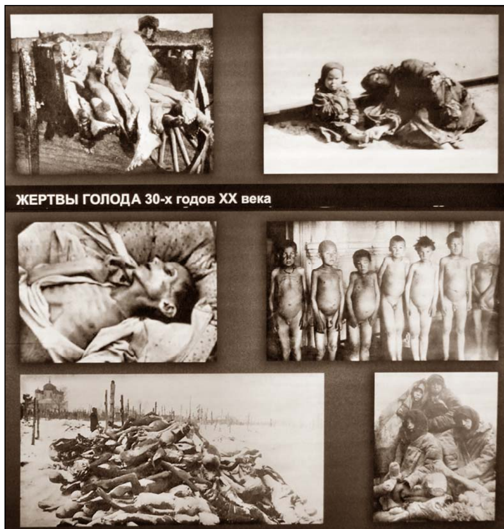
Obrázek 4. Oběti hladomorů ve 30. letech 20. století v SSSR. (Muzeum KARLAG, Dolinka, 2015).

Podle údajů Centrálního úřadu národohospodářské evidence Gosplanu SSSR se v roce 1932 počet obyvatel Kazachstánu snížil z cca 5,8 mil. obyvatel na cca 2,5 mil., z toho emigrace se týkala 1,3 mil. lidí.