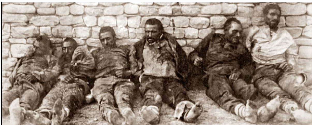
Obrázek 1. Oběti „rudého teroru“ ve 20. letech 20. století. (Muzeum KARLAG, Dolinka, 2015).

V obecném povědomí je zřejmě nejznámější ukrajinský hladomor z let 1932–1933 s nejtragičtějším vrcholem na počátku roku 1933, na jehož přímé i nepřímé následky zemřelo 4–7 mil. obyvatel. Dnes je téměř nemožné na základě sovětských statistik určit pravou příčinu hladomoru (podle těchto statistik byla totiž celková úroda v roce 1932 vyšší, než v letech 1930 a 1931, což ovšem nekoresponduje s výpověďmi pamětníků), svoji roli určitě sehrál vypjatý ukrajinský nacionalismus, se kterým chtěl Stalin rázně skoncovat, nebo nechut' rolníků pracovat na polích, když neměli možnost nakládat s vypěstovanou úrodou a byli nuceni prodávat státu obilí za nesmyslně nízké ceny. Každopádně systém povinných (často nesplnitelných) odvodů byl velice účinným nástrojem pro likvidaci odporu proti kolektivizaci.