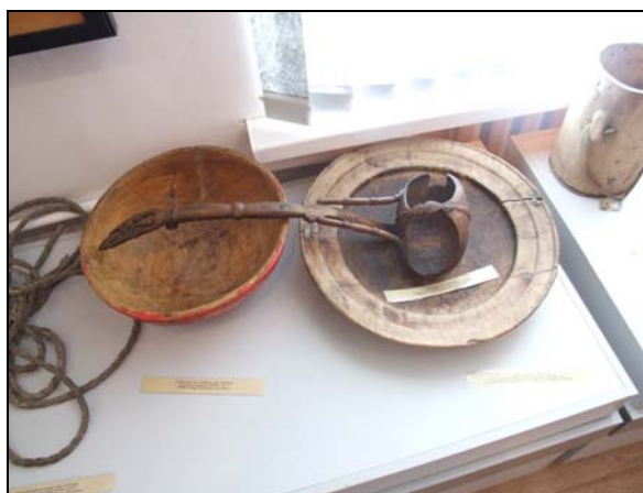
Obrázek 2. Přemíst'ování Kazachů.