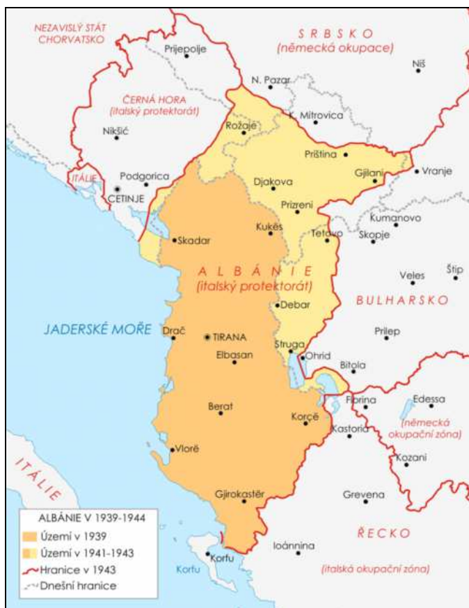
Obrázek 3. Vývoj hranic Albánie za 2. světové války

Během éry Envera Hodži bylo dělení na Tosky a Gegy zakázáno. Sám Hodža byl Tosk a Toskové tak měli lepší sociální pozici než Gegové. Enver Hodža usiloval o jednotnost albánského národa a jeho vyhlášení Albánie jako první ateistické země na světě rovněž souviselo se snahou, aby Albánii náboženství nerozdělovalo.